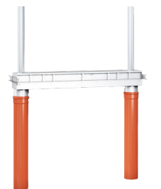
Bild på PVC-rören.